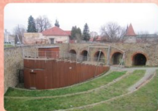
9 | Horná brána The Upper Gate