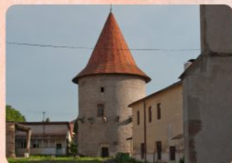
11 | Kláštorňá bašta The Monastery Bastion