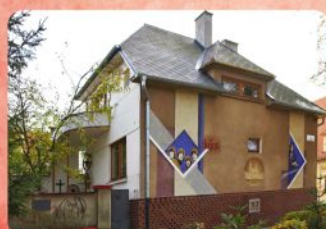
15 | Ulička Johna Lennona John Lennon Alley