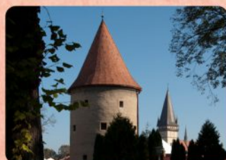
12 | Školská bašta The School Bastion