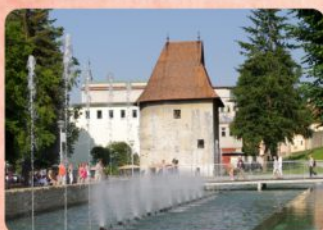
13 | Archívna bašta The Archives Bastion