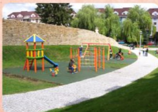
10 | Detské ihrisko Playground for children