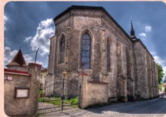
5 | Kláštor - kostol sv. Jána Krstiteľa Monastery - Church of St. John the Baptist