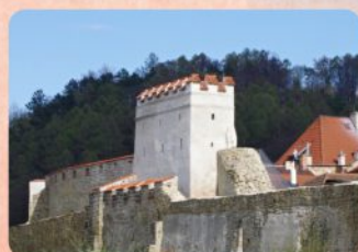
14 | Renesančná bašta The Renaissance Bastion