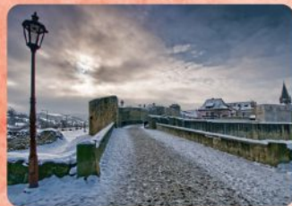
6 | Dolná brána The Lower Gate