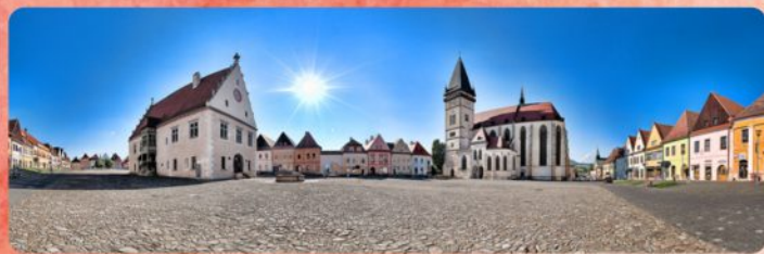
1 | Radničné námestie Town Square