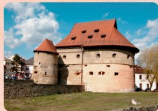
8 | Hrubá bašta The Thick Bastion