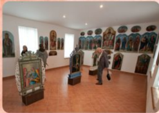
4 | Múzeum Ikon - expozícia Museum of Icons - Exposition