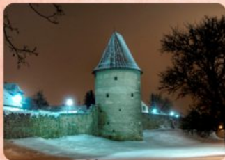
7 | Veľká bašta The Big Bastion