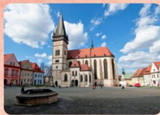
2 | Bazilika minor sv. Egýdia - expozícia Basilica Minor of St. Aegidius - Exposition