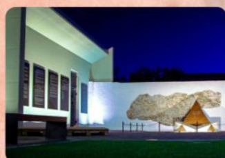
17 | Pamätná záhrada holokaustu Holocaust Memorial Garden