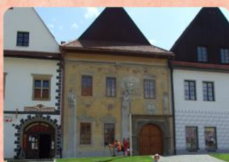
16 | Gantzughofov dom Gantzughof House