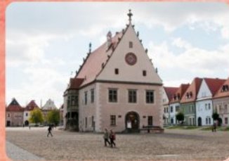
3 | Radnica - expozícia Town Hall - Exposition