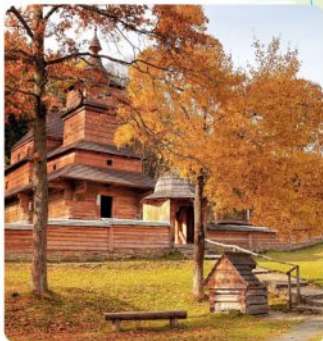
8 Bardejovské kúpele (6 km) Múzeum ľudovej architektúry tel: 00421 54 479 44 07